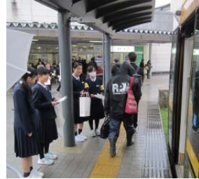
奥田・岩瀬中学校の生徒さんが協力