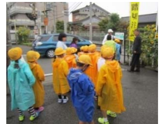
踏切指導 (御蔵町踏切)

・秋の全国交通安全運動期間中、東岩瀬駅構内、御蔵町踏切にて富山北警察署の協力で、この踏切を使って登校している岩瀬小学校の1・2年生に、安全な踏切の渡り方を指導しました。