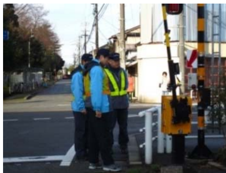
12月12日 社長巡回 (蓮町踏切)

・車両・線路・信号・踏切・橋梁・駅・変電所等の各施設・設備の保守点検を実施するとともに、運転士には基本動作の徹底等、安全運転に関する重点指導を実施しました。 ・期間中は、社長が職場巡回を行い、社員に安全指導と点検指示を行いました。