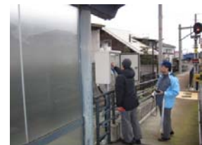
保安装置(大広田駅)

・大広田駅～岩瀬浜駅間において、信号故障を想定した保安装置の操作方法を、実際の電車を使って行いました。